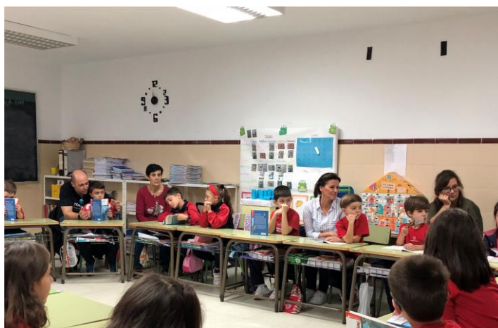
Tertulias Literarias Dialógicas