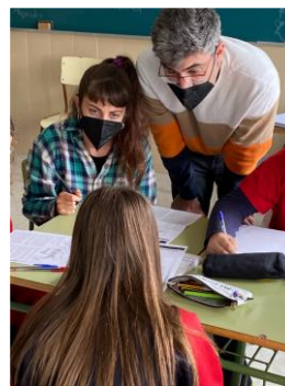
Grupos interactivos en ESO.

Son un enfoque contrario a la exclusión de las aulas de alumnado con adaptaciones curriculares, aprendizajes lentos o conflictivos. La estrategia no es sacar de las aulas, sino que entren más recursos de ellas.