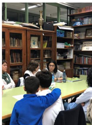
Comisión de Hábitos saludables

Una vez clasificado los sueños en categorías, se forman estas comisiones con todo aquel que quiera trabajar en conseguir hacer el centro soñado por todas. Los grupos se proponen unos objetivos trimestrales o anuales y se reúnen de forma periódica para decidir qué hacer, cómo y cuándo. Las comisiones tienen libertad de decisión y ejecución, ya que siempre, siguiendo los principios dialógicos se trabaja por conseguir los dos objetivos fundamentales: acelerar el aprendizaje y superar las desigualdades.